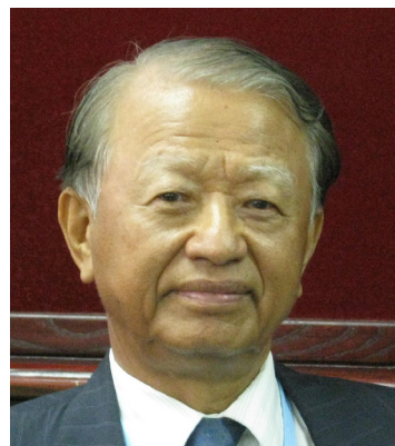
2024 國家卓越建設獎 評審團

本人擔任評審團總召集人十九年來，每年都在全體評審委員共同的價值觀下，修訂與時俱進的評選標準，齊心追求卓越的城市建設與建築發展，也共同建立環境價值觀、追求實踐建設理念。在之前社會的想法中，「安全、實用、美觀」是建設所追求的基本三要素，近年則在此基礎上更加關照建築的「人文、科技、藝術」三面向，並專注在「低碳環保、發揮地方文化特色」等世界性的時代精神。評審團期待所有建設皆具有卓越導向功能，一同達成 LOHAS (Lifestyles of Health and Sustainability) 一健康與永續的生活環境—之最終目標。